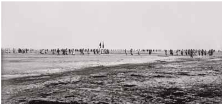
Наступление пехотных частей Красной армии по льду Финского залива во время подавления Кронштадтского мятежа.

Вот как это было. М.И. Калинин, всероссийский староста и известный петроградский большевик, хорошо знакомый с Кронштадтом и благополучно доживший до 1946 года,