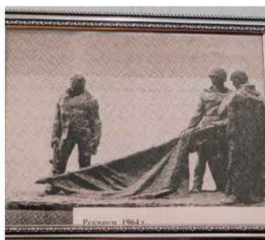
Реквием. 1964 г.