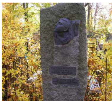
Памятник на кладбище