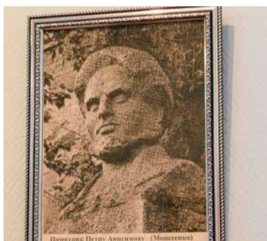
Памятник Петру Анисимову (Моисеенко). 1960 г.