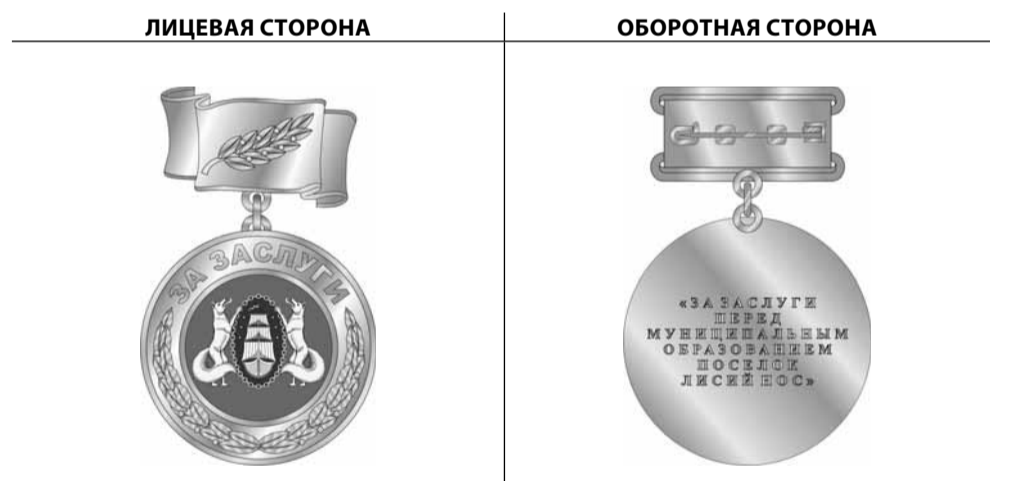
Приложение № 2 к Решению Муниципального Совета МО поселок Лисьий Нос от 14.03.2019 г. № 38